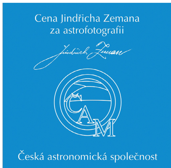
Plaketa Ceny Jindřicha Zemana za astrofotografii.

„ Zatímco Česká astronomická společnost vznikla 8. prosince před 102 lety, takže už jde o úctyhodnou matronu, je Česká astrofotografie měsíce pouhá dorostenka, která 1. prosince letošního roku dosáhne věku, kdy se dorostenkám vydávají občanské průkazy. V době, kdy jsem se před více než 70 lety začal zajímat o astronomii, nebyly astronomické snímky příliš rozšířené. Fotilo se na málo citlivé černobílé emulze a technika zacházení se snímky byla komplikovaná vinou malé kvantové účinnosti fotografických emulzí a zdouhavé práce v temné komoře, kde se snímky vyvolávaly, ustalovaly a sušily. Přesto i tehdejší černobílé snímky zejména hvězdné oblohy a mlhovin mne fascinovaly. Ještě v době, kdy mi končil mandát předsedy České astronomické společnosti, byla podstatně komplexnější barevná astrofotografie záležitostí pro bohaté hvězdárny a soukromníky, ale rychlý pokrok zobrazování oblohy vyvolaný kombinací detektorů CCD a inteligentního softwaru pro zpracování digitálních snímků se projevil tím, že někdejší heslo České astronomické společnosti ‚Do každého města lidovou hvězdárnu; do každé domácnosti dalekohled‘ lze dnes zaměnit za jednodušší: ‚Kaž-