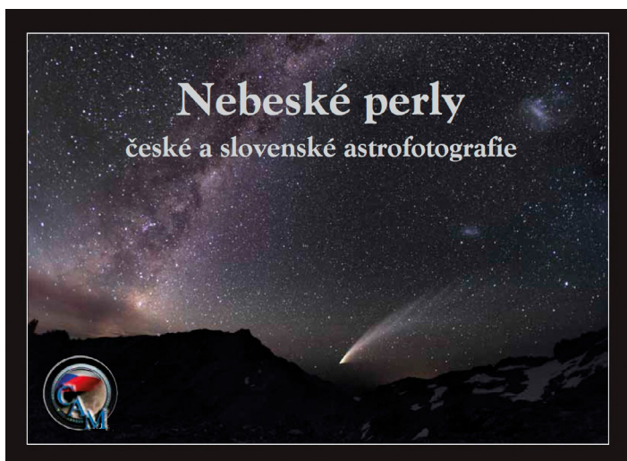
Kniha ČAM – Nebeské perly české a slovenské astrofotografie vydané k desátému výročí soutěže ČAM.

děmu fanouškovi astronomie digitální kameru, a hin sa ukáže! Domnívám se, že otcové zakladatelé ČAM přesně vystihli ten okamžik, kdy se stalo pořizování astrofotografií přístupné nejširší veřejnosti a kdy se meze fantazie astrofotografů dotýkají i hvězd na zem spadlých z nebe. Díky soutěži ČAM se řada českých i slovenských astrofotografů doslova zrodila, jak je patrné z patnáctileté přehlídky snímků měsíce. Už vícekrát jsem se přistihl, že se mi příslušná ČAM líbila víc než záplava unikátních snímků z velkých pozemních i kosmických observatoří. Jsou to zejména širokouhlé barevné snímky oblohy, které prozrazují, že zdánlivě temný prostor pozadí svítí pastelovými barvami svědčícími o rozsvícení atomů a molekul různých prvků do velké vzdálenosti od ionizujících zdrojů. Nepochybují o tom, že ČAM bude dlouhodobě prosperovat, protože hlubiny vesmíru zaručeně skrývají tolik dalších unikátních objektů a konfigurací, že astrofotografové celého světa budou mít stále nespočet příležitostí něco nového vyfotit, neboť vesmír hned tak neskoná.“