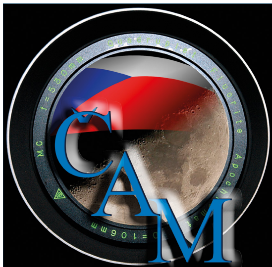
Oficiální logo projektu Česká astrofotografie měsíce (ČAM).